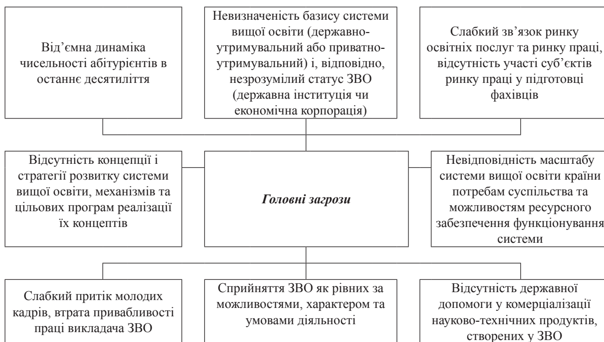
Рис. 2. Головні загрози системі вищої освіти в Україні

Завдяки популярним навчальним програмам (Erasmus Mundus, Fulbright Program, Muskie і UGRAD) щороку за кордон виїжджає близько 20 тисяч молодих українців [17]. У 2015–2016 навчальному році українська молодь